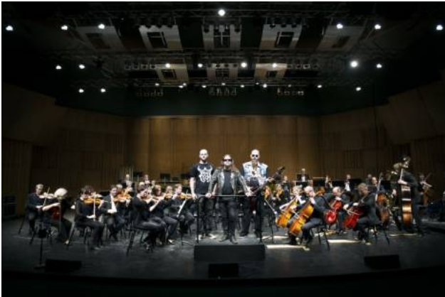
Symfonimetal. Sorcery från Sandviken kommer att spela med Gävle symfoniorkester i början av nästa år. Och kanske även ditt metalband. Anmäl dig till vår tävling på arbetsbladet.se